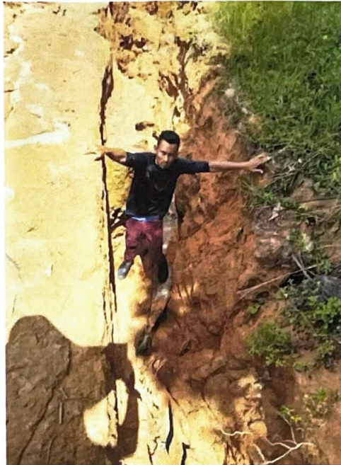
Figura 1 - Vala com profundidade suficiente para comportar uma pessoa inteira, representando risco à integridade dos professores e estudantes.