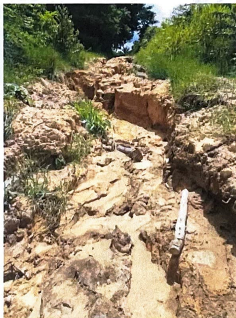
Figura 2 - Trecho de ramal com valas e voçorocas em formação.